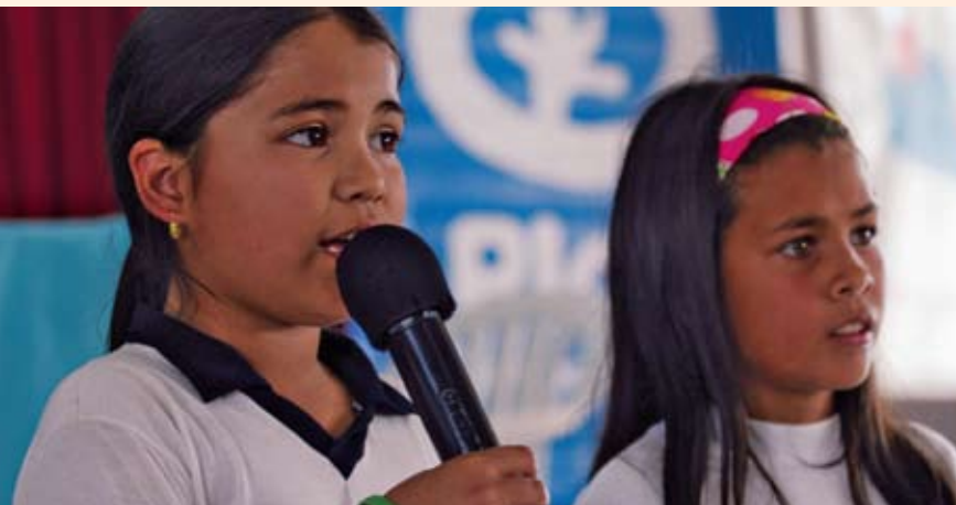
Garotas de um grupo de direitos infantis, Paraguai.