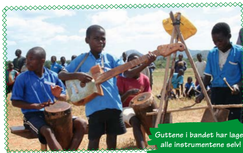
Guttene i bandet har laget alle instrumentene selv!

Nesten alle måltider består av noe som heter nsima, som er en slags tjukk grøt laget av maismel. Nsimaen dyppes i en felles bolle med en blanding av blant annet gresskarblader. På landsbygda er det ikke vanlig å bruke kniv og gaffel, du