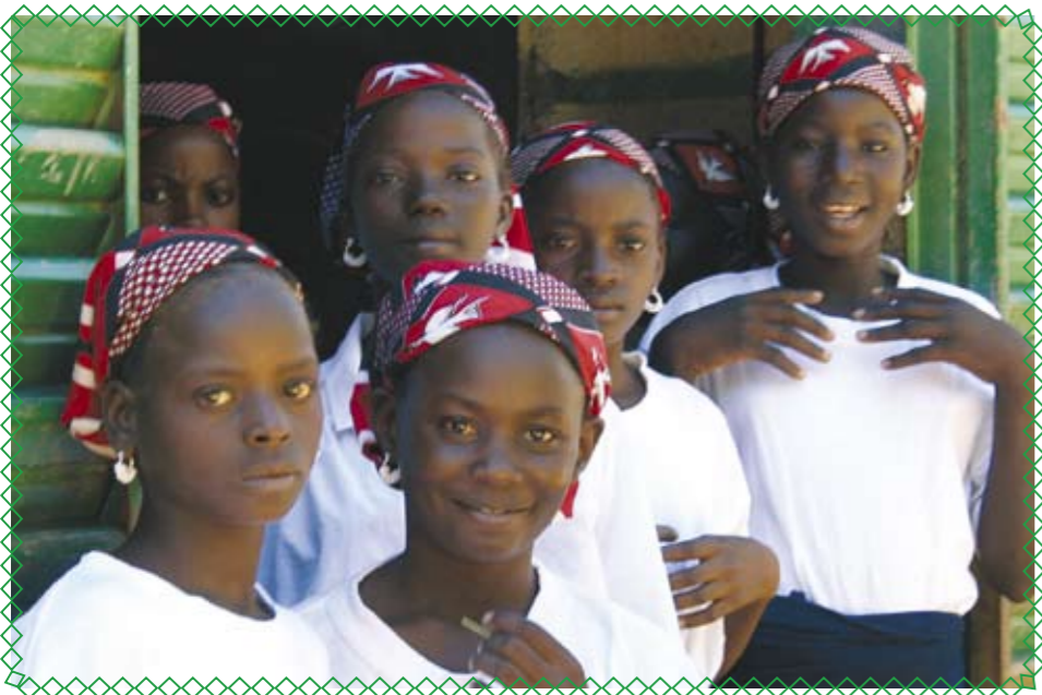
Innbyggere i Burkina Faso kaller seg Burkinabè

Navnet Burkina Faso betyr «Det ærlige folket», og faktisk er det sånn at ærlighet er typisk for innbyggerne i dette vestafrikanske landet. Det er lite kriminalitet her, og folk er for eksempel ikke redde for å gå alene om kvelden. Det eneste er at man ikke bør kjøre bil på landet om natten, for da kan man møte landeveisrøvere.