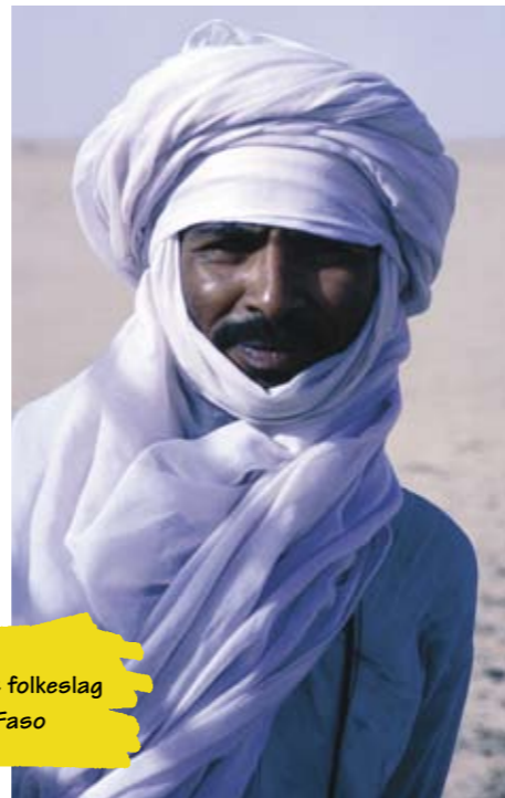
Tuaregene er et folkeslag i Burkina Faso

Tuaregene er et folkeslag i Burkina Faso. Deres håndverk er lett å kjenne igjen. Dette nomadefolket kom til landet med sine kamelkaravaner, og ble med tiden bofaste i landet. På SIAO-messen ses deres lett gjenkjennelige skinnnesker i farger som brunt, blått eller burgunder. De lager også kjeder, der flotte sølvfigurer henger på tråder med små, svarte perler.