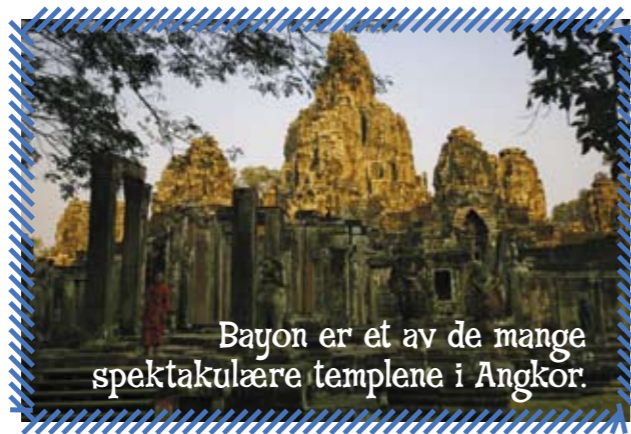
Bayon er et av de mange spektakulære templene i Angkor.

Den første byggegale kongen som slo seg til i Angkor, het Jayavarman 2. Han var ikke bare gal etter å bygge, men sprut gal på flere andre måter også. I en tid da ingen bygget store bygg - man tror at området var ganske fattig - samlet han flere tusen mennesker for å få dem